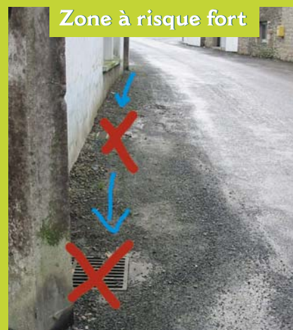
Quemperven - Rue de la Mairie

effets, la démarche ne doit pas s'arrêter à la modification des méthodes communales. Chaque jardinier doit apporter sa pierre à l'édifice en modifiant ses pratiques de désherbage. C'est vrai à Quemperven et ce sera vrai dans les nombreuses communes du territoire qui vont adhérer prochainement à cette démarche pour l'eau et pour l'avenir de notre territoire.