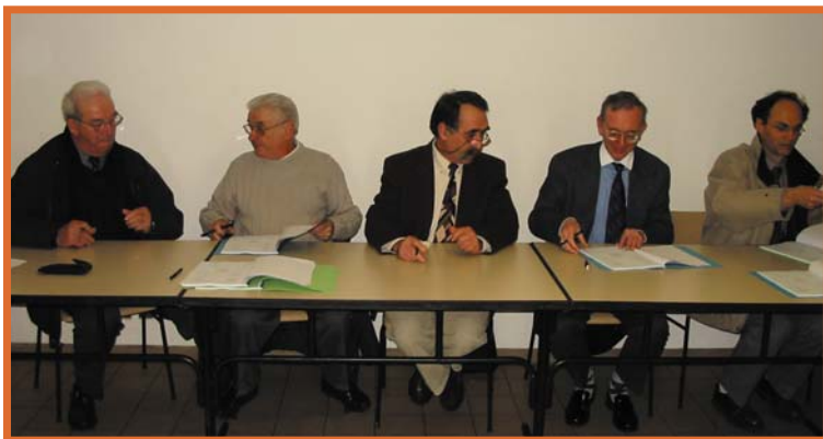
Signature du contrat par les partenaires de l'opération

Si les modifications de nos pratiques de jardiniers, les engagements de nos agriculteurs et les efforts des communes permettent d'améliorer la qualité des eaux de notre territoire par une utilisation différenciée des produits de traitements, d'autres moyens d'intervention existent. L'aménagement et l'entretien de nos cours d'eau font aussi partie des outils utilisés dans le bassin versant pour reconquérir la qualité de nos eaux. La signature du contrat de restauration et d'entretien du Jaudy et du Bizien, le 18 février dernier, en est le parfait exemple.